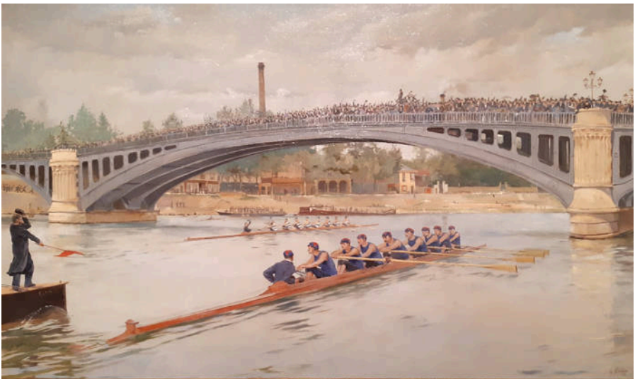
Ferdinand Gueldry, 'Match annuel entre la Société nautique de la Marne et le Rowing Club'