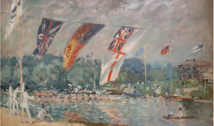
Alfred Sisley, 'Regates à Molesey'

Ook sommige impressionisten waren geïnteresseerd in het roeien, zoals de Frans-Engelse Alfred Sisley (1839-1899). Hem ging het niet om een zo realistische mogelijke weergave, hij was geïnterigeerd door het spel van water, licht en feestelijk wapperende vlaggen. In zijn Regates à Molesey (1874), waarin een roeiwedstrijd op de Theems te zien is, hoeven we niet te zoeken naar een gedetailleerd weergegeven dol, al had hij op een ander niveau wel degelijk oog voor detail.