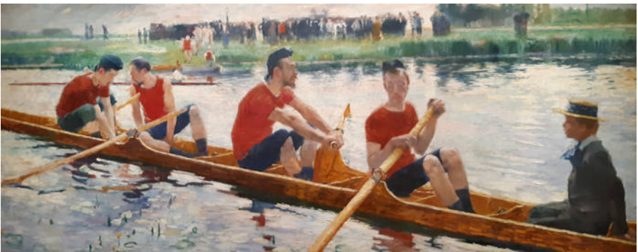
Guillaume Séraphin Van Strydonck. 'Les Canotiers'

Een tussenpositie tussen naturalisme en impressionisme neemt Les Canotiers in (1889), van de Belgische Guillaume Séraphin Van Strydonck (1861-1937). Sommige gedeelten lijken vrij schetsmatig geschilderd, maar de boot – inclusief de dollen – is bij nader inzien behoorlijk gedetailleerd afgebeeld.